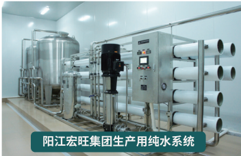
阳江宏旺集团生产用纯水系统