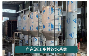
广东湛江乡村饮水系统