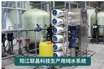
阳江联昌科技生产用纯水系统