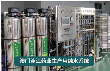
澳门泳江药业生产用纯水系统