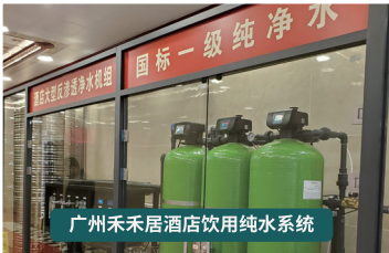
广州禾禾居酒店饮用纯水系统