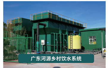
广东河源乡村饮水系统