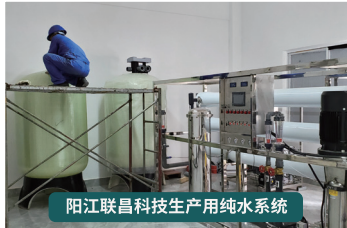
阳江联昌科技生产用纯水系统