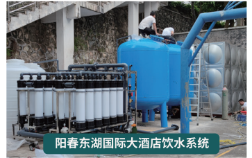
阳春东湖国际大酒店饮水系统