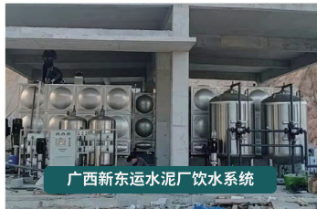
广西新东运水泥厂饮水系统